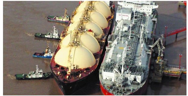
Barco de Petrobrás con GNL en Escobar

La necesidad de divisas, el odio hacia el Estado y lo público, la desatención a la comunidad científica y la falta de planificación de otras ciudades, de otras economías locales y sociales y de otras energías trae consecuencias como las actuales. Finaliza el mes de mayo de 2024 y en Argentina más de 300 industrias y estaciones de servicio para automotores de GNL (gas natural licuado) están sin gas.